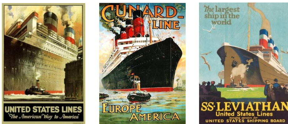
Рисунок 1 – Реклама водного транспорту поч. ХХ ст.

З метою стилістичного аналізу туристичної реклами та визначення її естетичного рівня, варто стилу розглянути рекламу круїзів, яка у вигляді плакатів існує від початку ХХ ст. (рис. 1). Якщо в II пол. XIX – I пол. ХХ ст. були дуже популярними туристичні поштові картки з краєвидами різних країн, то вже к середині ХХ ст. став найбільш поширеним рекламний плакат великих і середніх форматів, – він дещо наївний з сьогоденської точки зору, зображально прямолінійний, але набагато частіше має художню образність та оригінальність, ніж сучасний. Гори та море були основними об'єктами, що рекламувалися в той час з метою розвитку туризму. Географічне розташування європейських країн дозволяло активно використовувати для подорожей водний транспорт. Популярні були рейси з Англії до Німеччини, між країнами на середземноморському узбережжі та тривалі трансконтинентальні круїзи. Це був час знаменитих кораблів «Британіка», «Олімпіка», «Океаніка», сумнозвісного «Титаніка» тощо. Крім мігрантів, на їхній борт піднімалися і заможні туристи, – отже подібні заходи вимагали широкомасштабної реклами в стилі ар-деко. В серії рекламних плакатів карибських круїзів кінця 1930-х рр. у США використали нестандартні зображальні засоби – малюнки піратів у різних ситуаціях (рис. 2).