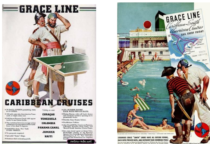
Рисунок 2 – Реклама круїзів по Карибському морю, 1938-1939 рр.

За часів СРСР перший круїз Ленінград–Одеса з заходом в європейські країни відбувся 1957 р. У 1970-80-х рр. подорожі морями та поїздки до далеких країн були не